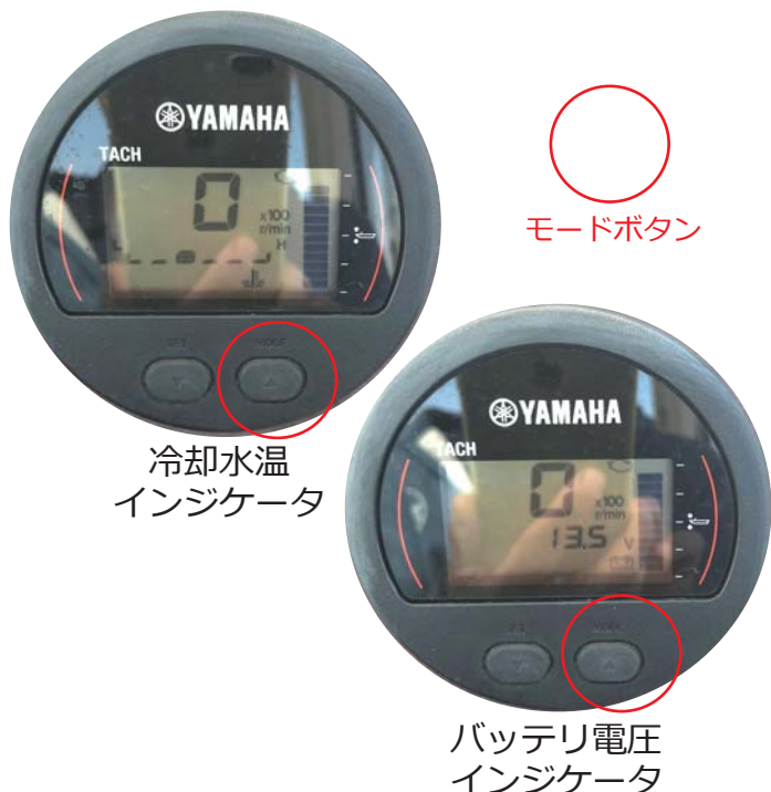
冷却水温 インジケータ